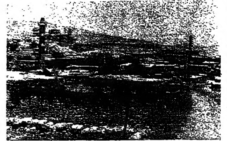
منظر عام لبلدة بكا